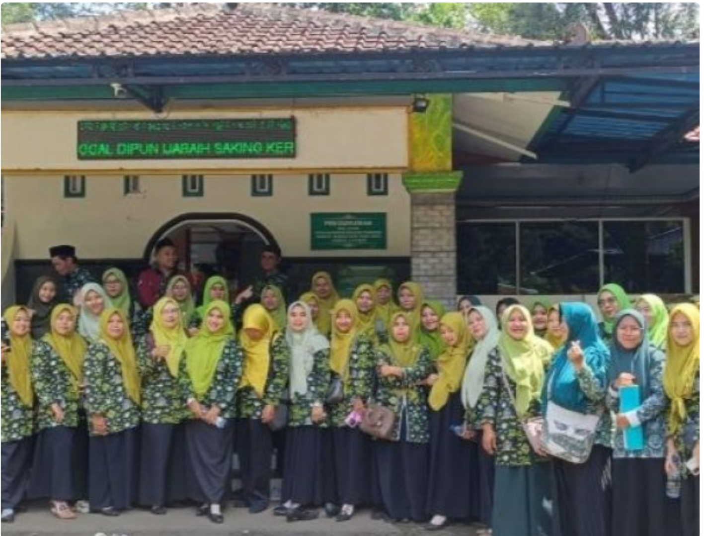
Sambut Ramadhan, POKJA MI Ma'arif NU Karanglewas laksanakan Ziarah

KARANGLEWAS - POKJA MI Ma'arif NU Kecamatan Karanglewas Banyumas, Jawa Tengah, laksanakan ziarah ke Makam Syekh Maqdom Wali Karanglewas, dalam rangka muhasabah diri, menyambut Bulan Ramadhan 1446H/2025M,